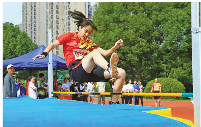
图为李兴贵中学的学生在校运会比赛中。

金秋硕果满枝头,唯有书香最醉人。站在新的起点,浙江书展正在朝着打造有重要影响力的文化盛会、全国知名的全民阅读示范点、全国一流水平的省级书展的目标奋进。