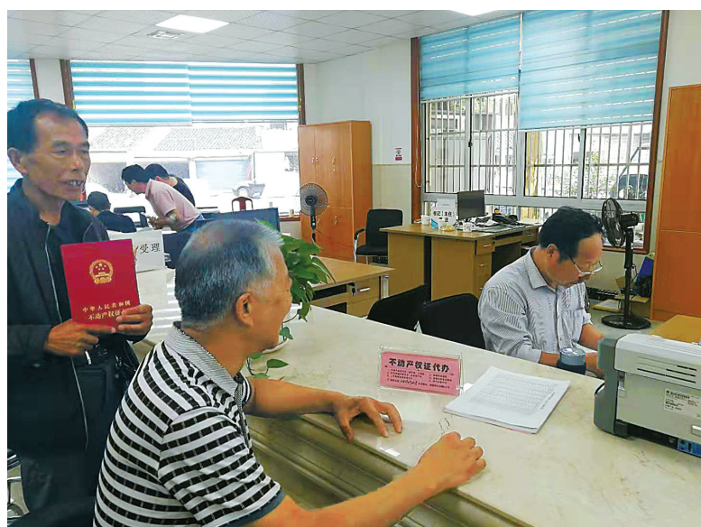
周巷镇界塘村农民在村民服务中心就可办理不动产权证书。

截至今年9月，全市共完成权籍调查772659户，占总农户数的80%；完成农房登记487273户，占符合条件农户数的88%。