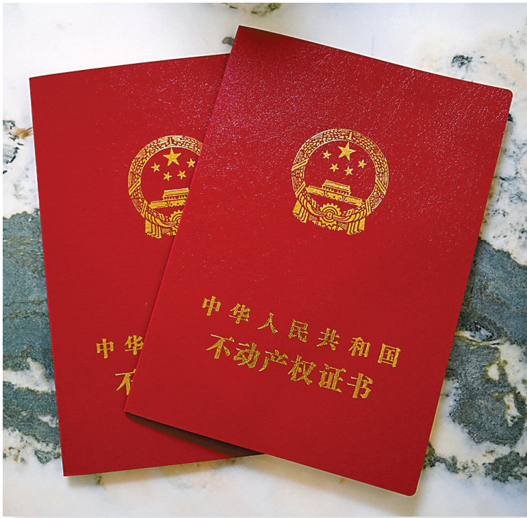
颁发给农民的不动产权证书封面。

据宁波市自然资源和规划局初步统计，截至今年9月，全市共完成权籍调查772659户，占总农户数的80%；完成农房登记487273户，占符合条件农户数的88%。