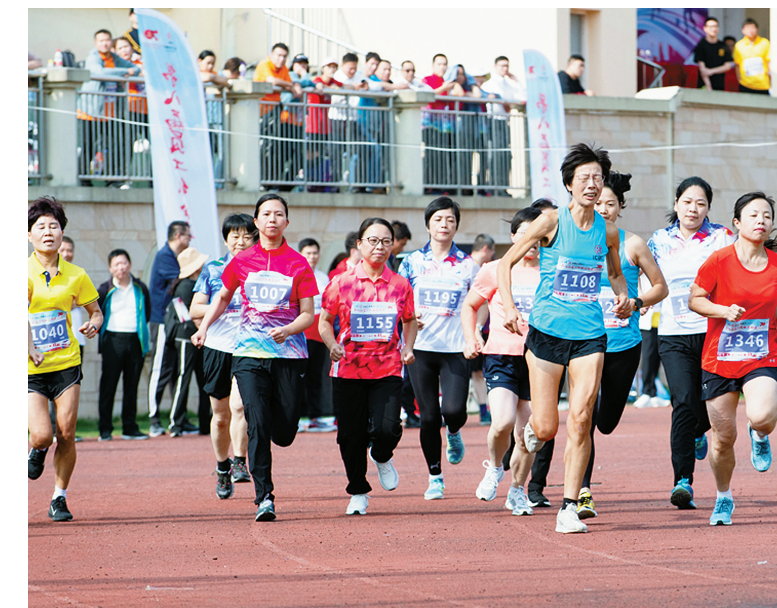
10月19日,工行宁波市分行第八届员工综合运动会在宁波海曙外国语学校火热举行。图为员工们在参加长跑比赛。

今年以来,农行宁波市分行不断推进金融扶贫的广度和深度,尤其是不断创新线上扶贫模式。前期还推出了“种小树”全民公益活动,客户只要登录农行掌上银行,进入“种小树”游戏页面,每日登录游戏进行签到,就可体验各类有趣的游戏环节。同时,用设置话费奖励的方式吸引客户参与;还可通过浇水、施肥等让小树苗结出果实,客户把取得的果实折算成一定的金额,捐助给贵州黔西南扶贫结对公益项目和四明山留守儿童公益项目。(葛敏敏)