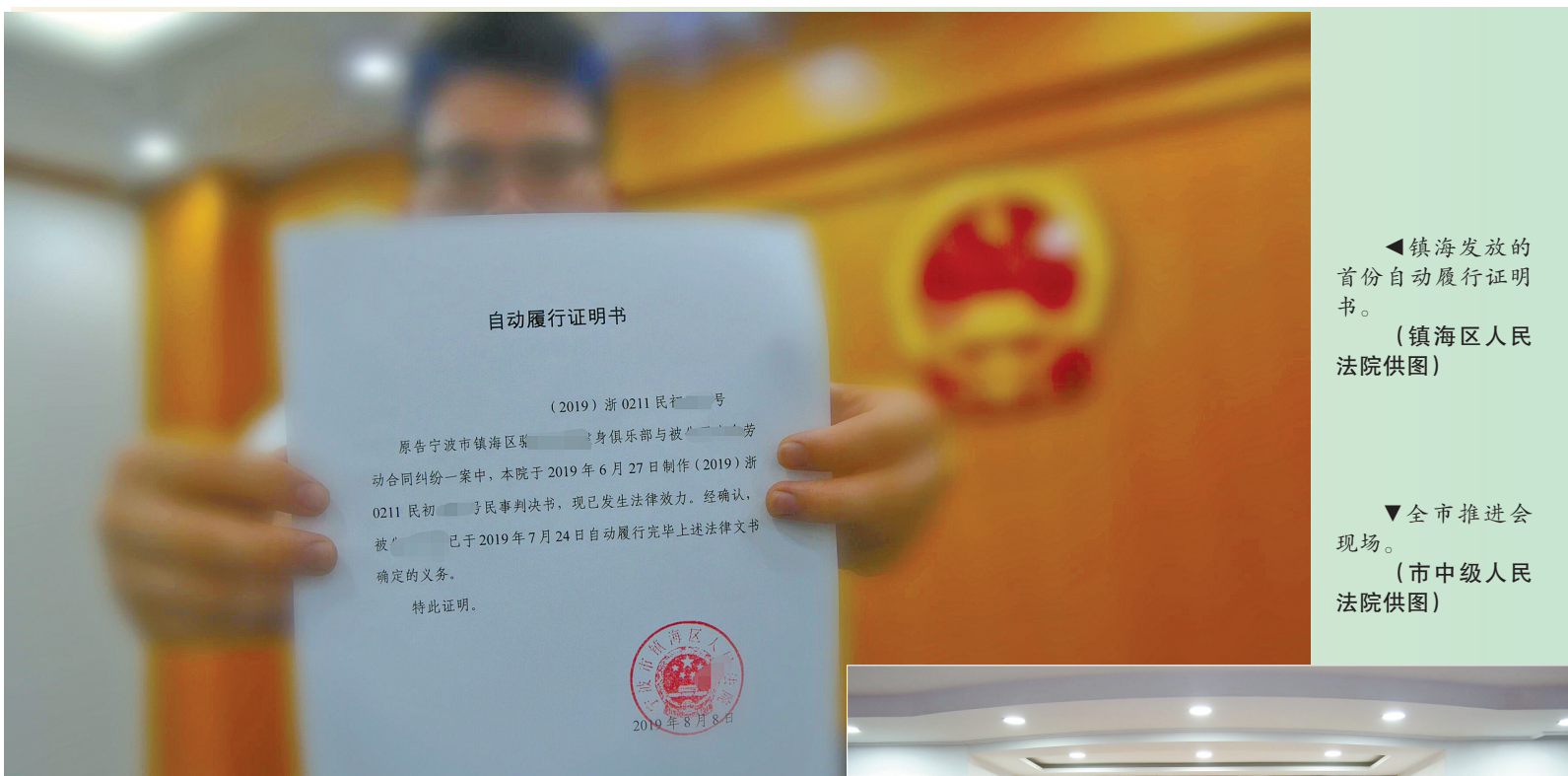
▲镇海发放的首份自动履行证明书。