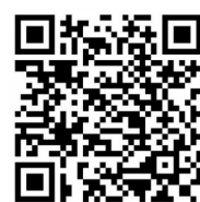
报名请扫描二维码

本次活动更多的详情请见: http://hd.cnnb.com.cn/z2019/zgyddj/index.shtml 。(陈莹)