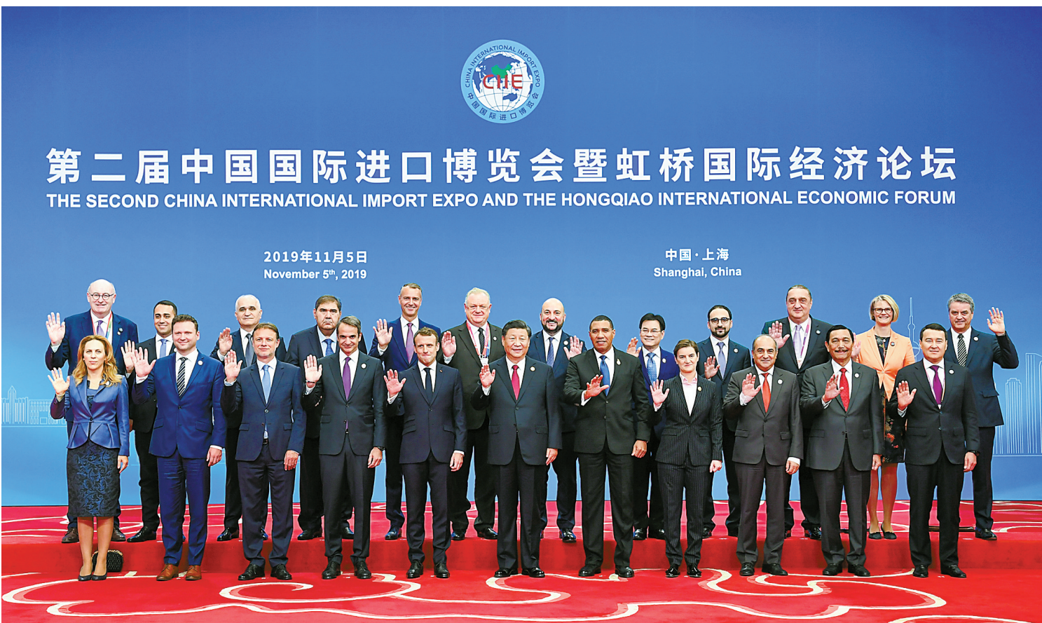
开幕式前，习近平同外方领导人集体合影。