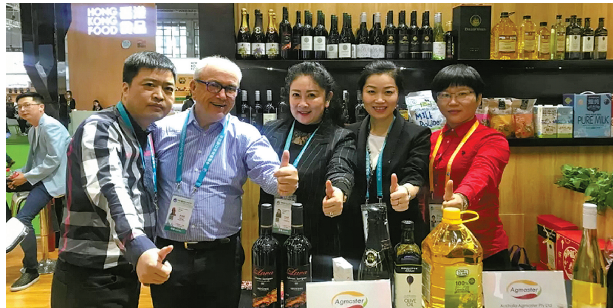
进博会上，外商与中国伙伴一起点赞宁波。

市发改委负责人指出，为加快长三角一体化进程，我市将着力打造对外开放门户。主动服务“一带一路”建设，发挥好中国-中东欧经贸合作示范区、中国-中东欧国家博览会、国家跨境电商综合试验区等开放平台叠加优势，建设好中意（宁波）生态园、海丝航运大数据中心等功能平台，争取浙江自贸区宁波片区扩区到宁波，深化最多跑一次改革，打造国际一流营商环境。