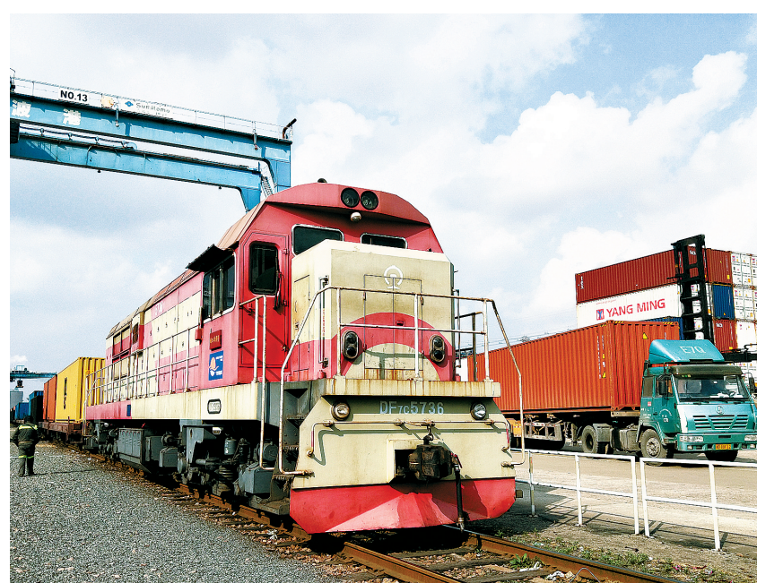
海铁联运为长三角腹地带来便利。