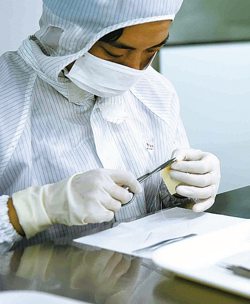
甬企在上海设立研究院，依托创新快速扩大市场。

面向未来，宁波正在打造一个更加强大的全面融入长三角的交通网络。着力构建多样化、高效率的综合