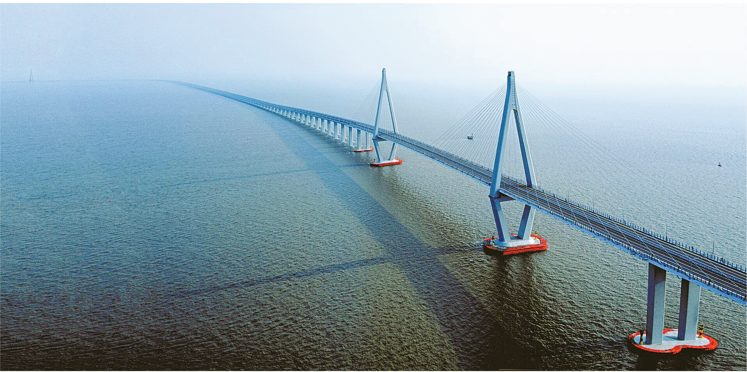
一桥飞跨融入长三角。