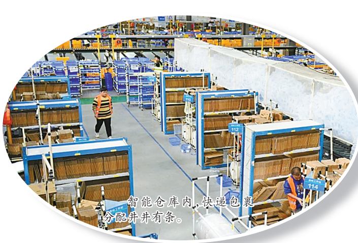
智能仓库内，快递包裹分拣井然有序。