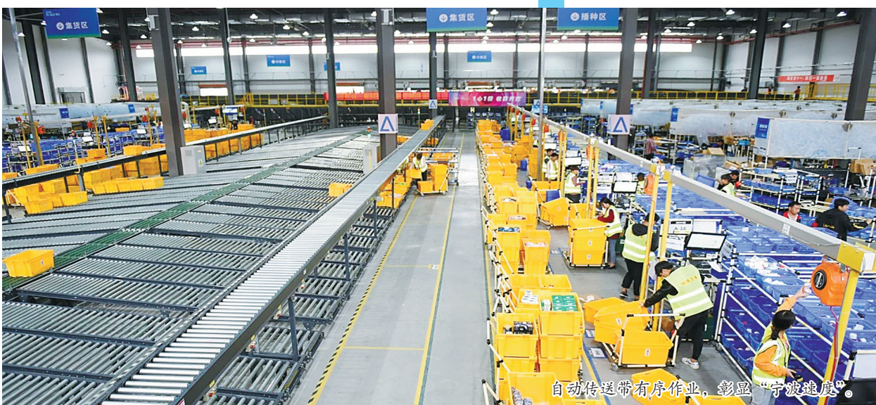
自动传送带有序作业，彰显“宁波速度”。