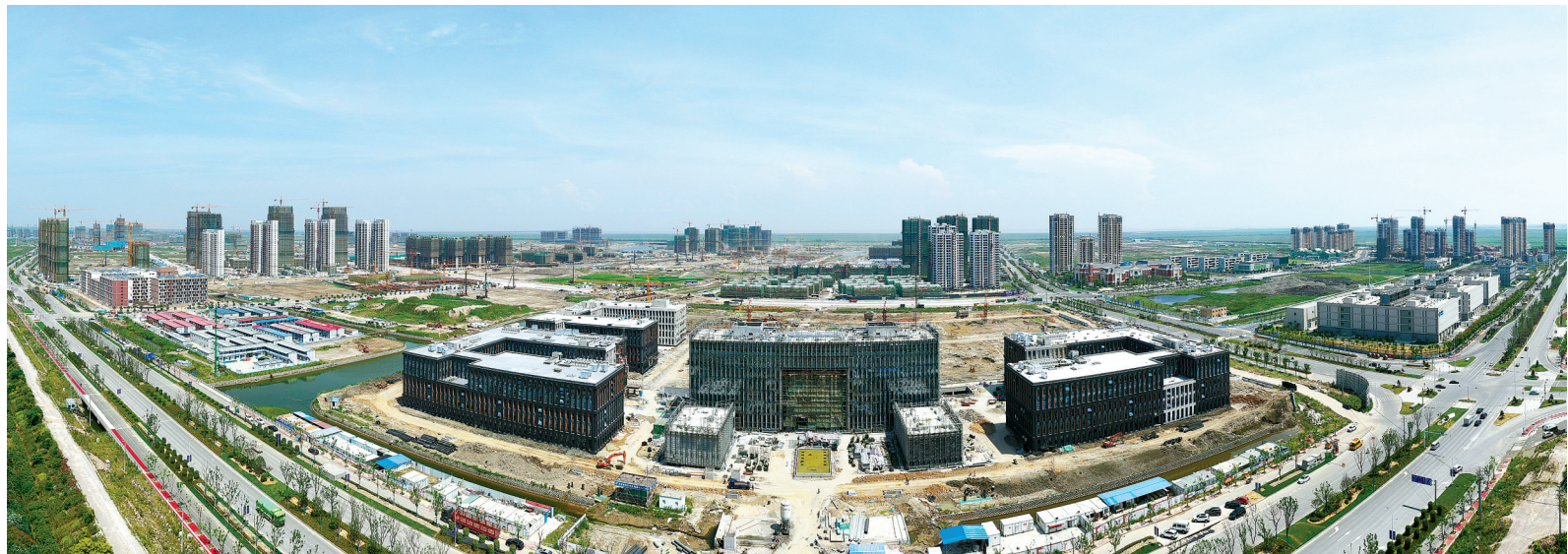
重大项目成为我市高质量发展的强劲引擎。

下一步，市发改委将强势推进“项目争速”，对标对账挂图作战，“奋战六十天”，确保完成省重点建设项目年度投资380亿元以上，市重点建设项目年度投资1000亿元以上，力争超额完成年度目标任务。