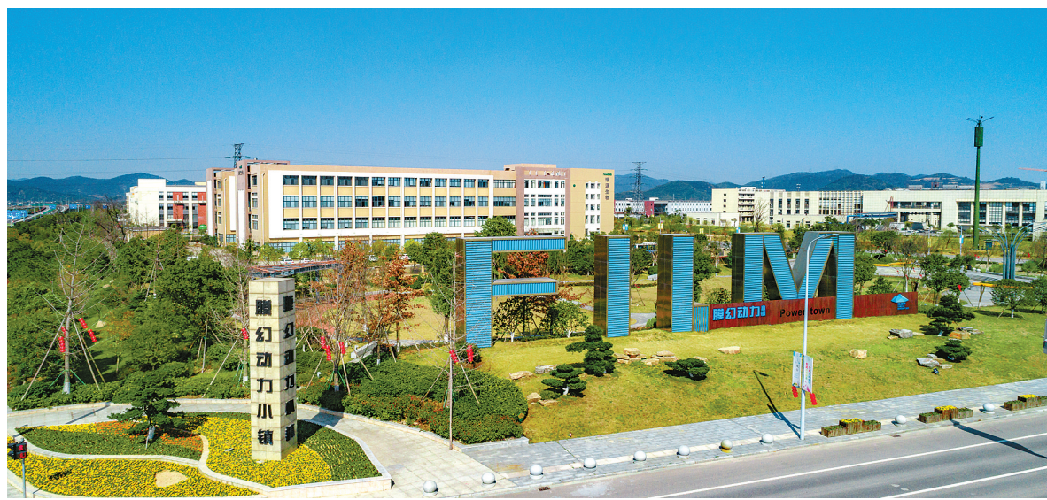
江北膜动力小镇一角。

二是“能级”与“能效”共进。各类创新创业主体和高层次人才加快集聚，特色小镇能级不断提升。截至今年9月底，我市省级特色小镇已累计引进企业2.4万家，其中国家级高新技术企业81家，涌现出长阳科技、公牛集团、舜宇集团等一批领军型企业，高性能膜材料、3D打印等前沿高端产品处于国内外领先水平。同时，我市特色小镇的能效不断