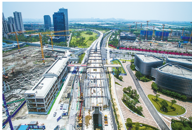
我市重大项目建设正在如火如荼进行。

今年以来，市委市政府高度重视“项目争速”特别是重大项目建设，34位市领导亲自联系120个工作对象，其中园区23个、重点项目81个、特色小镇16个。市发改委坚持把服务项目作为开展“不忘初心、牢记使命”主题教育的重要平台，认真贯彻落实省委省政府、市委市政府工作部署，扎实开展“大学习大调研大抓落实”“三服务”等活动，委主要领导带头、全委广泛发动积极参与，围绕招商引资、项目落地、项目推进等方面，深入基层开展“三服务”活动74次，走访项目320个，现场解决问题56个，带回来研究解决问题18个。同时积极创新项目协调机制，从去年底开始，每月召开全市扩大有效投资重大项目协调例会，由市政府常务副市长召集，发改、财政、国土、规划、环保、审计、国