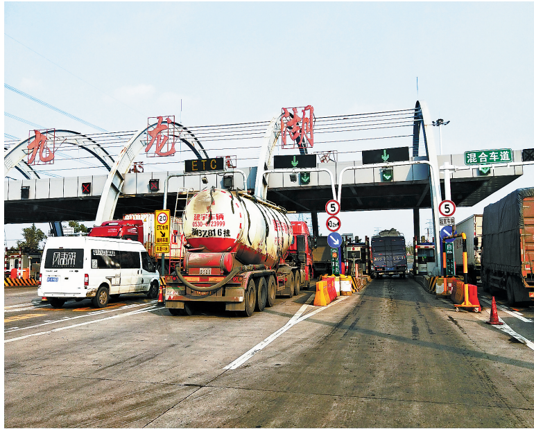
货车排队通过高速公路人工通道。