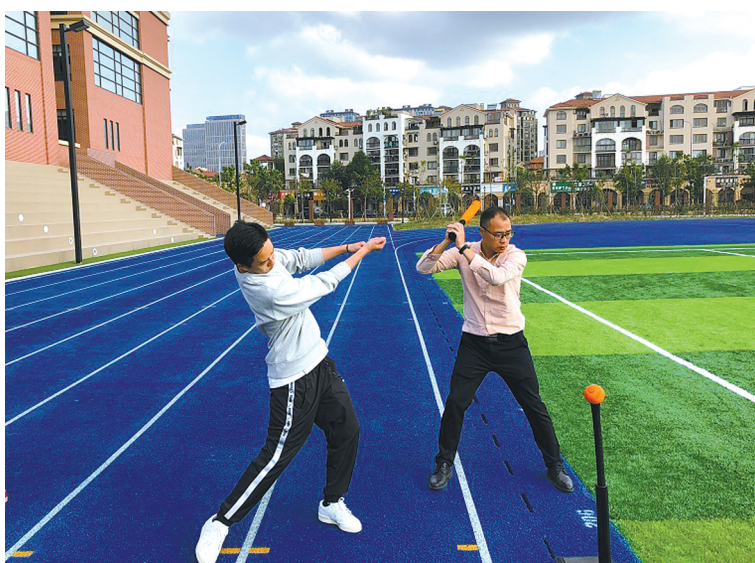
图为棒球训练场景。

“在政府部门资金、编制有限的情况下，由社会力量筹办体育项目，宁波棒球运动的发展之路值得肯定。”省棒垒球协会秘书长潘朝春表示。