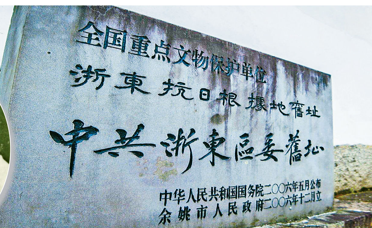
浙东抗日根据地旧址(资料图)