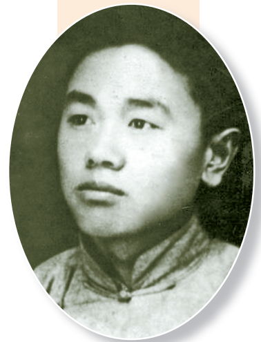
“左联五烈士”之一的殷夫