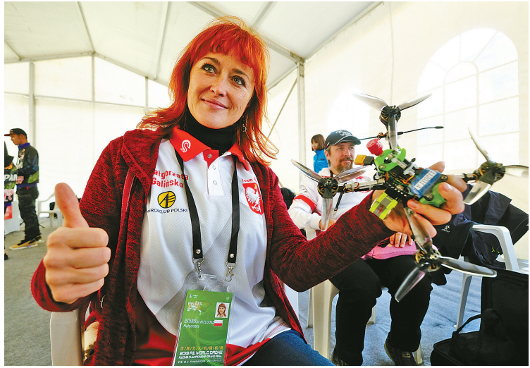
图为选手正在调试无人机。

的成功举办开创了世界无人机项目发展的历史。他希望通过这次无人机锦标赛以及一系列活动的成功