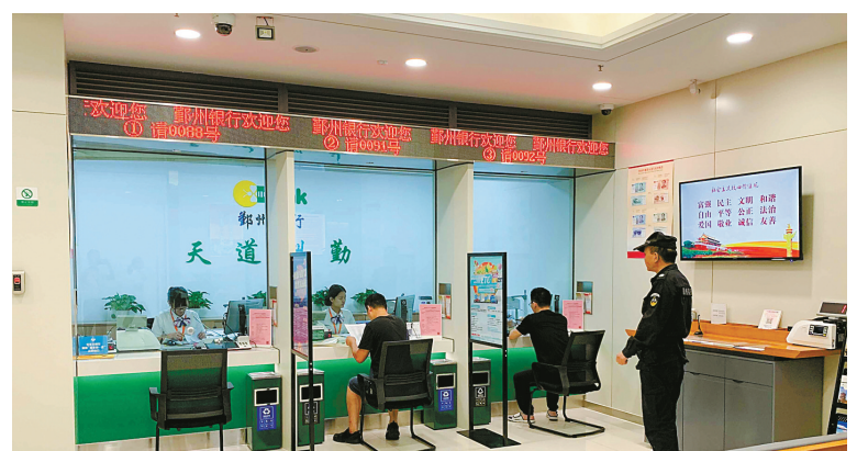
为方便市民夜间办理业务,鄞州银行营业部市民中心分理处每逢周二将服务时间延迟到19:30。(王俊)

增强业务风险防范能力。业务准入方面,市场参与成员在交易中心进行资料备案,通过专线接入本币交易系统,保证了机构身份的真实性;账户管理方面,交易双方通过本币交易系统确认账户信息,可