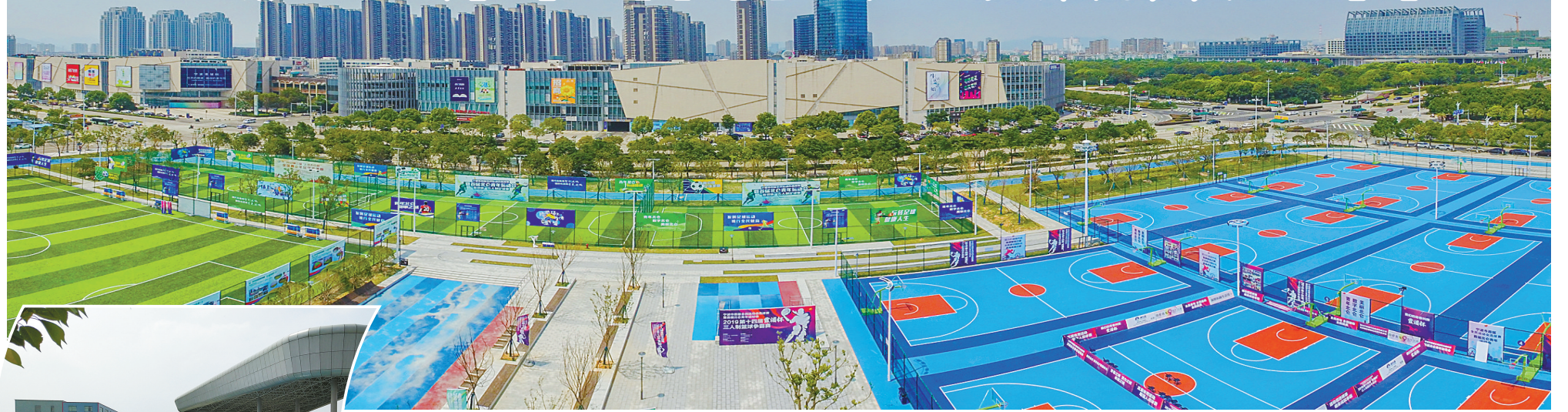
北仑青年体育公园的全景