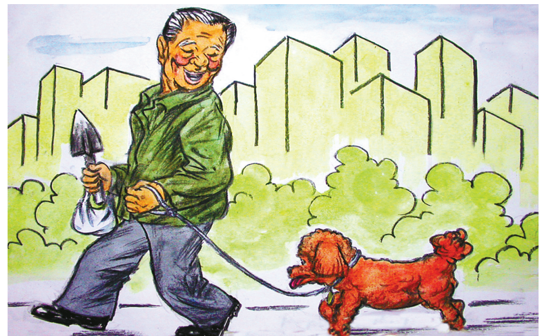
文明养犬已经成为多数市民的自觉行为（丁安 绘）

今年，工委委围绕委员履职保障大做文章。一方面，注重搭建平台，延伸履职触角。继续用好委员工作室这一创新制度，今年先后组织了第三批创建活动，新增市级委员工作室23家，省级委员会客厅8家，共计创建市级委员工作室28家，省级委员会客厅10家，实现了从“盆景”到“风景”、从“样品”到“品牌”的转变，成为设在群众身边的“委员之家”。另一方面，注重强培训，提升委员履职能力。“依托全国政协干部培训基地，争取用三年时间实现政协委员和机关干部轮训全覆盖。”根据这个目标，今年先后两次组织政协委员和机关干部参加全国政协培训，做好提升“两支队伍”能力素质的文章，受众面达到350人。参训者普遍反映，培训既高屋建瓴又接地气，理论性、指导性、启发性都很强，是一次难得的思想盛宴。