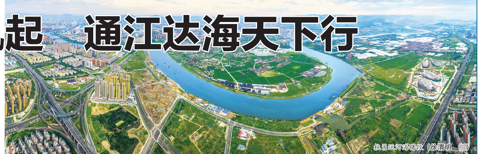
杭甬运河海曙段

蜿蜒连绵的航道,就是一道美丽的风景长廊。奉化江航道是规划中的宁波市主要骨干航道,其中奉化江东岸铜盆浦大桥—江夏桥10.5公里这一段,自然植被茂密,绿化景观带与流淌江水相映成景,江上舟楫往来,构成了一幅生态航道