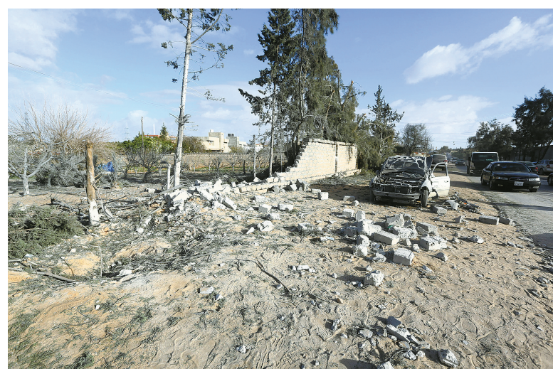
这是12月24日在利比亚首都的黎波里东部地区塔来拉炮击现场拍摄的车辆残骸。当日,利比亚首都的黎波里东部地区遭炮击,造成4名平民死亡,6人受伤。