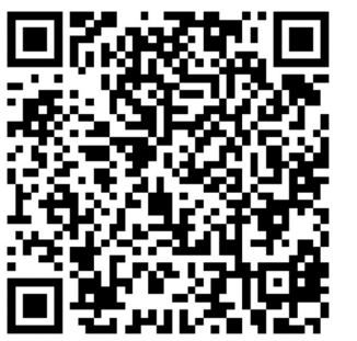
《关于促进劳动力和人才社会性流动体制机制改革的意见》全文请扫描二维码。