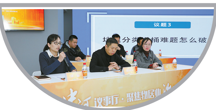
第三期“中河议事厅”：聚焦物居业治理