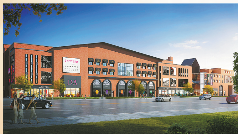
东遇艺术里效果图