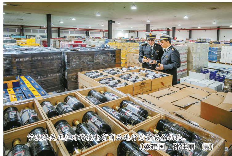
宁波海关正在对跨境电商商品进行质量安全抽检。