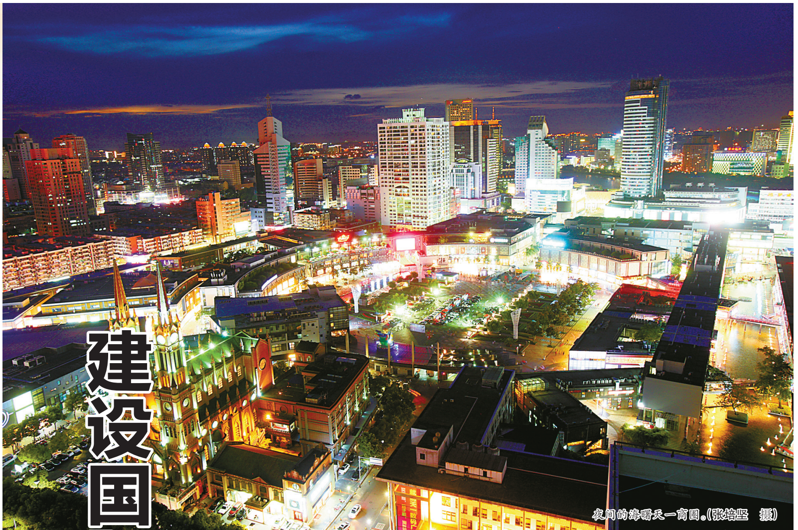
夜间的海曙天一商圈。

宁波还拥有市场外向度高、活力四射的民营企业。他们不仅是宁波转型升级的主力军，同样也是建设国际消费城市的重要主体。据了解，截至11月底，民营企业作为全市进出口主力，进出口总额达5612.2亿元，同比增长9.7%，占同期宁波市进出口总额的67.5%。