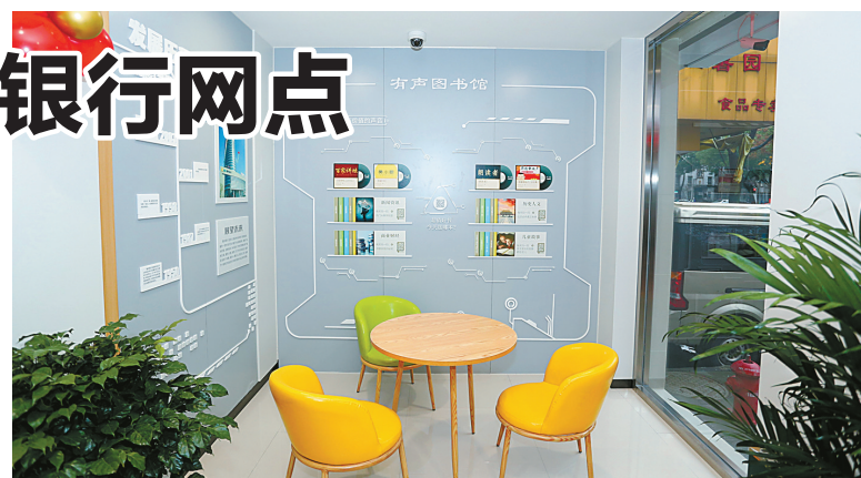
网点一角整洁明亮。 客户在此可以免费听读电子书。通过融入特色化服务理念,“智慧网点”的厅堂实现了集智能化、综合化、场景化、生活化于一体,让客户体会到科技成果创新在网点服务中的应用。 未来,鄞州银行将始终坚持“以客户为中心”,通过数字化转型不断提升服务效能。 (周亚芬 加希尧)

约受理业务,到网点等候办理之余,可以到公众教育区观看最新的金融资讯,或到理财服务区了解该行的理财、信贷等信息。 “智慧网点”新增了人脸识别功能,将前来办理业务的客户推送到大堂经理PAD上,实现精准营销。在智能服务方面,以智慧柜员机为核心,快柜、自助终端、存单边柜、回单打印机等为辅助的“1+N”智能化业务处理模式,实现90%以上传统人工柜台业务由客户自助办理,极大地缩短了客户办理业务的时间。 月湖“智慧网点”特有的有声图书馆,是联合喜马拉雅有声读物平台,单独开辟的一处读书空间,