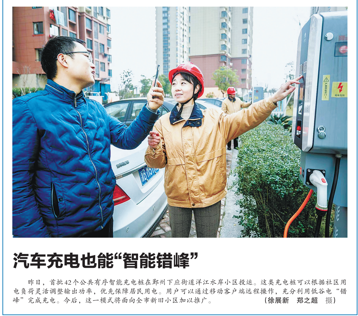
汽车充电也能“智能错峰”

“随着航空物流辐射面积扩大和与海曙的区域互动增加，临空经济可带动培育新兴产业和升级传统产业着手，布局航空新材料、大数据、电子信息、集成电路、检验检疫