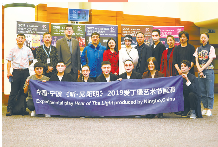
《听·见阳明》赴爱丁堡演出