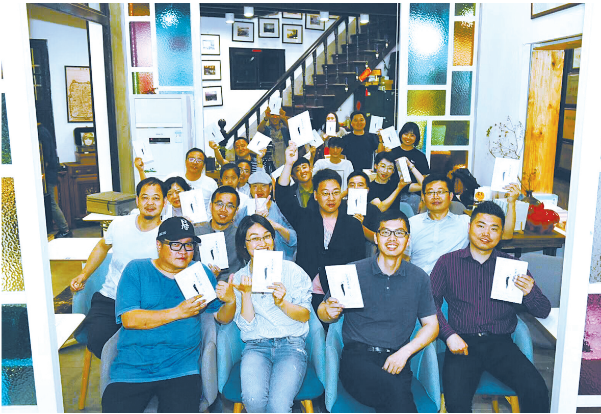
文化沙龙 (宁波市文化艺术研究院 供图)