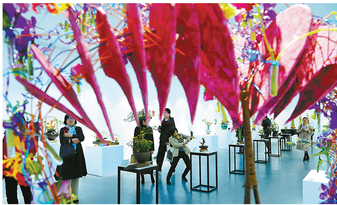
昨天,人们在宁波市文化馆117艺术中心观赏贺岁插花艺术作品。

本次展览共展出学员们创作的中国特色传统瓶、盘、篮、缸、碗、筒等六大器型插花作品和现代花艺。传统插花通过时令季节花材巧妙搭配,将点线面有机组合,表现了中国传统插花形式美、线条美、自然美、意境美、整体美的“五美”特征。现代花艺通过独具匠心的造型,借助架构、粘贴、捆绑、叠加、串联等创作手法,彰显了现代花艺构思新颖、色彩艳丽、造型独特、时尚前卫的特点。