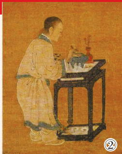
①仇英《焚香仕女图》(部分) ②杜堇《十八学士图屏》(部分) ③故宫博物院藏香工器具