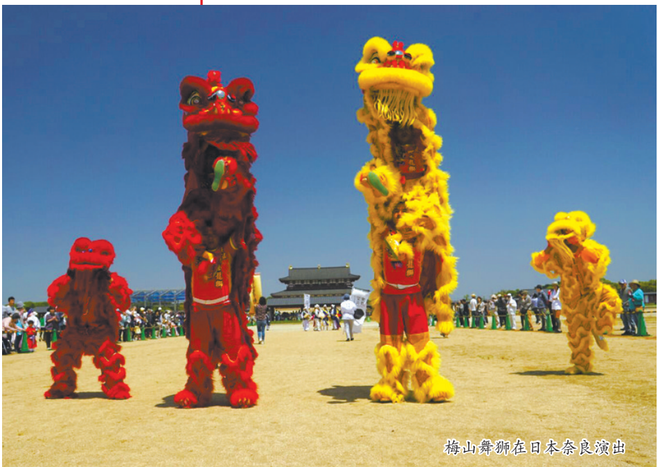
梅山舞狮在日本奈良演出