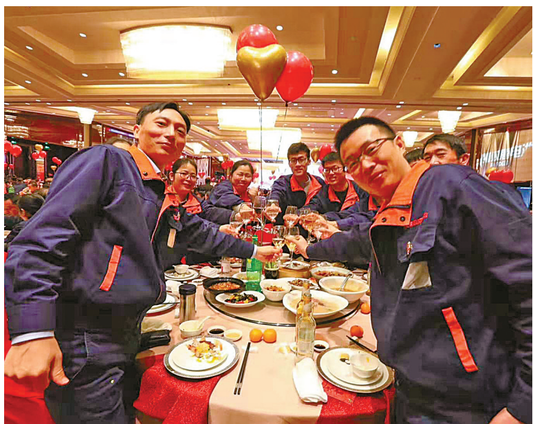
百桌千人的年夜饭将连摆三天,让每位员工都可以享受到团圆宴。

记者了解到,近年来,越来越多像双鹿这样的优秀企业,以各种方式表达对员工的关爱。宁波今日食品、华宇食品等企业,连续多年包车送员工返乡;海马电子不仅为职工报销来回车票,送行时还为职工送上大礼包等诸多暖心福利。同时,对于坚守在岗位上的员工,我市的企业也纷纷推出了年夜饭、电影票、旅游礼包等多种福利。