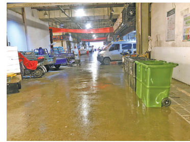
宁波水产品批发市场地面已无垃圾堆积。