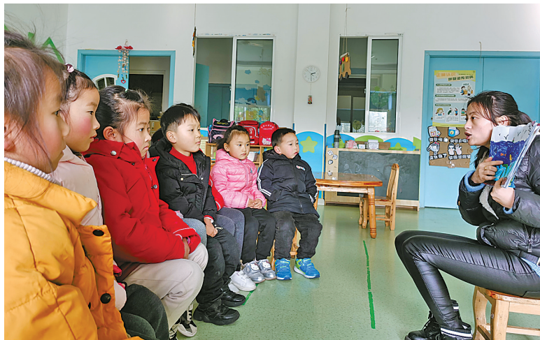
孩子在托管班听老师讲故事。

新碶街道大港社区是典型的工业社区,服务对象是500余家企业和近10万员工。“对于服装、物流、外贸企业来说,春节前后恰恰也是他们赶订单的高峰期。家中孩子如何安排,成了很多一线员工特别头疼的问题。春节快到了,我们的‘三服务’不能停。”大港社区党委书记朱红明说,为解决留守岗位的职工子女寒假无人看护照管的难题,去年寒假,社区党委、社区总工会牵头对接园区青藤大港幼儿园,开设免费托管班,受到广大职工的好评。今年该社区继续与幼儿园携手开办托管班,让双职工家