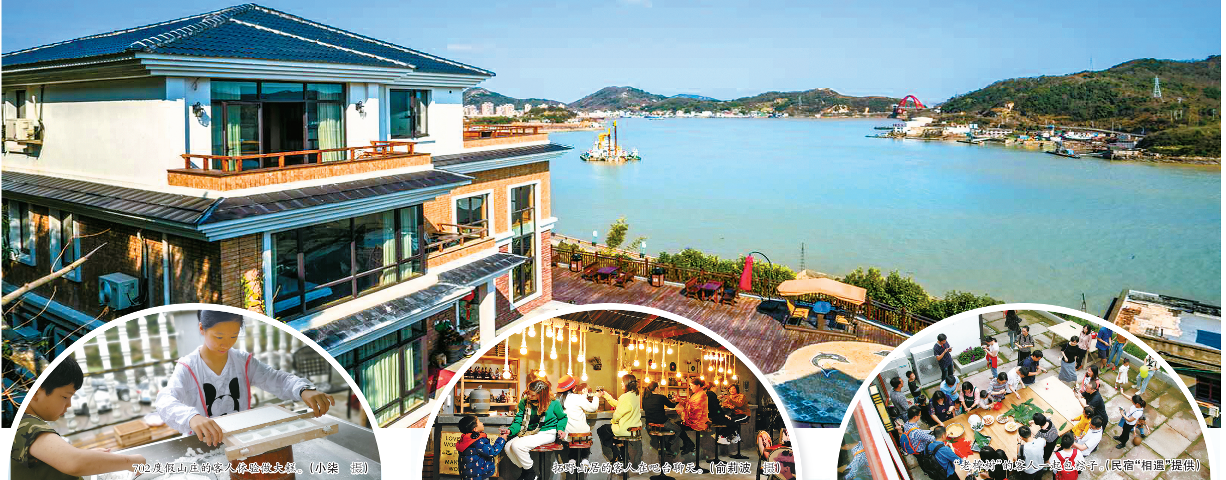
702度假山庄的客人体验做年糕。