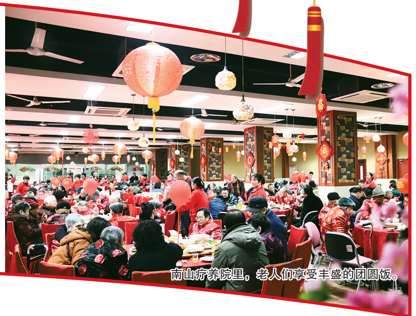
南山疗养院里,老人们享受丰盛的团圆饭。