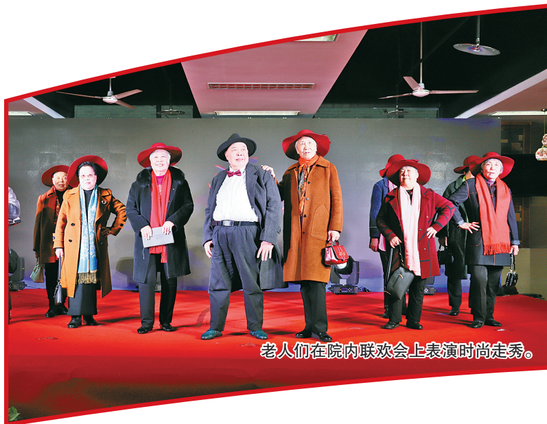
老人们在院内联欢会上表演时尚走秀。