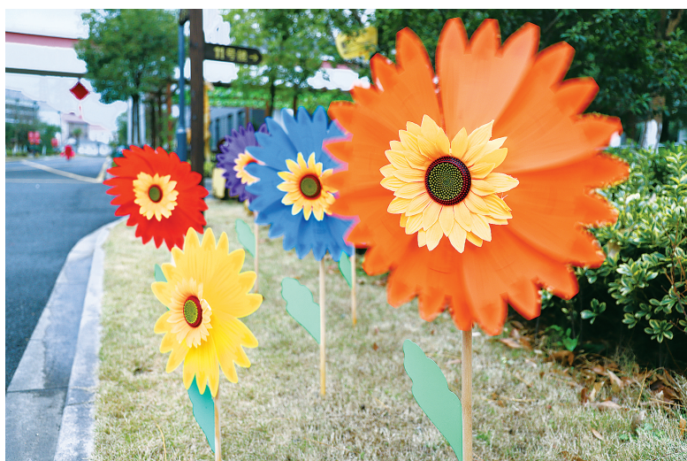
养老机构的新年布置,多了份童趣。

不仅是南山疗养院,我市许多养老机构正在开展一项项暖心服务,住养老人除小部分选择除夕回家或夜宿一晚,基本在养老机构过年。据不完全统计,今年我市有2万余名老人在养老机构过新年。