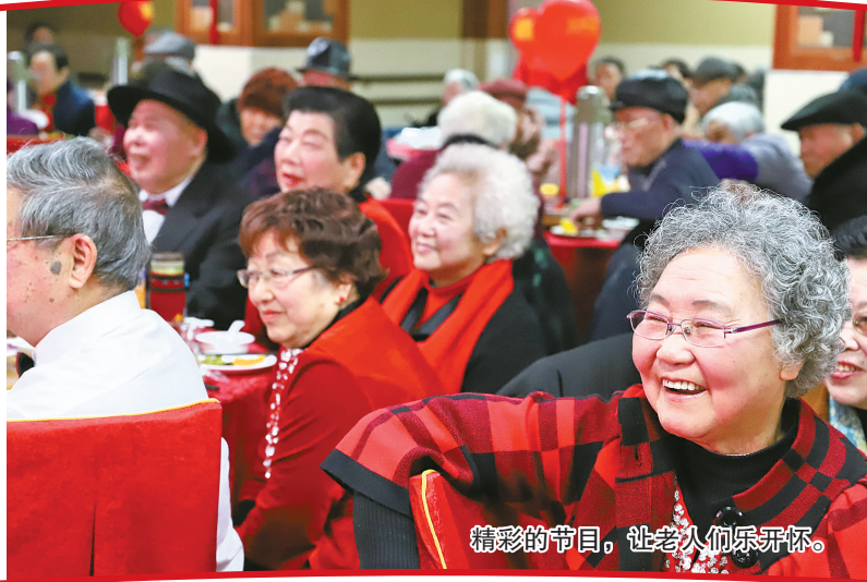
精彩的节目,让老人们乐开怀。