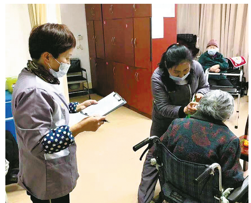
养老服务机构工作人员给老人测体温

老年助餐服务，一个都不落下。 为防止交叉感染，老年食堂暂时停办。对助餐服务有刚需的困难老人，必须想方设法落实送餐服务，不能因为防疫而漏掉一位老人；送餐服务也务必落实消毒、测量体温、佩戴口罩等防控措施。