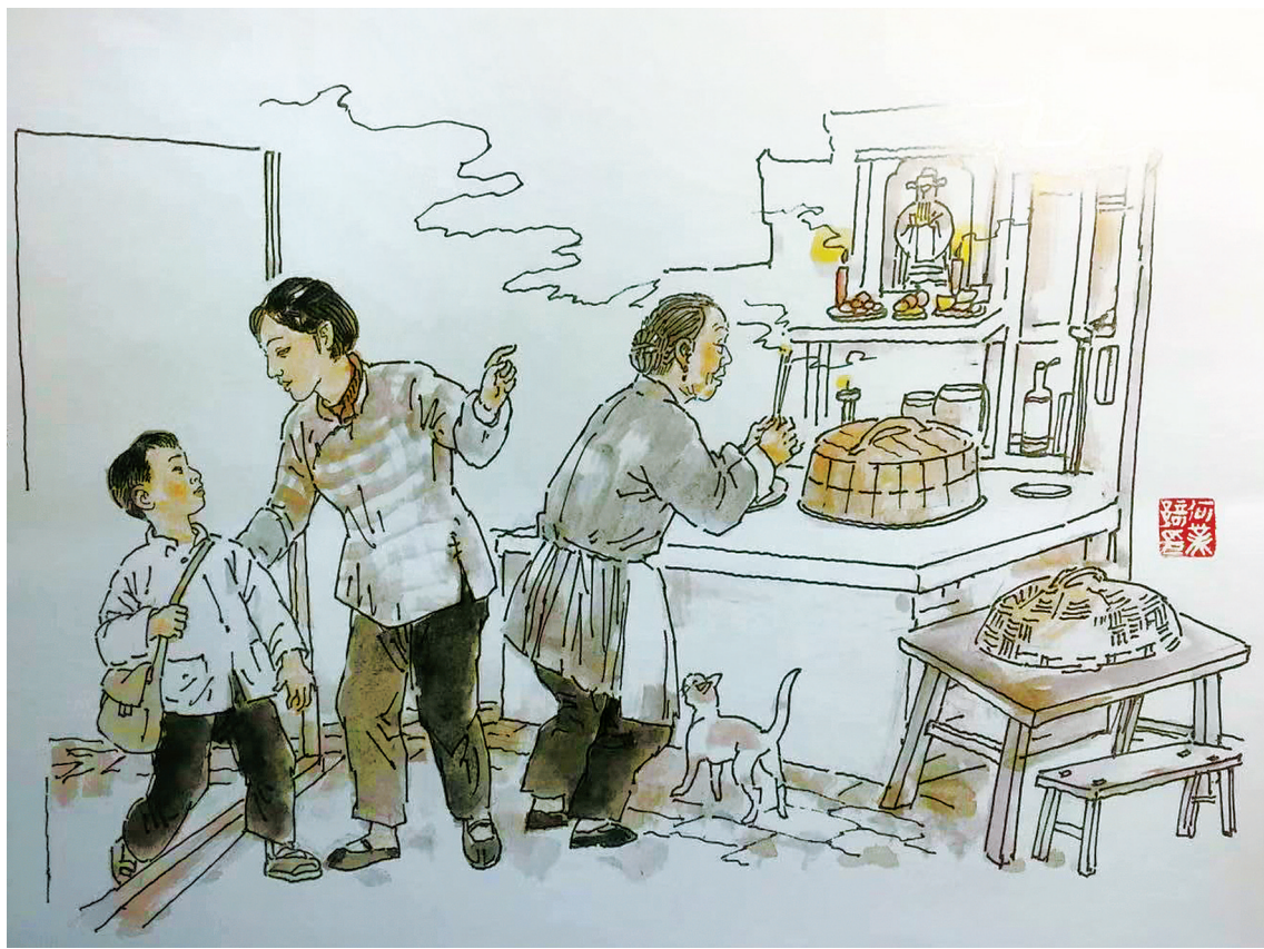
祭灶神 (何业琦 绘)

全民战“疫”，居家过年。这个有些特别的春节假期，相信不少人用陪伴相守，用阅读、运动等方式来度过“宅家”的日子。