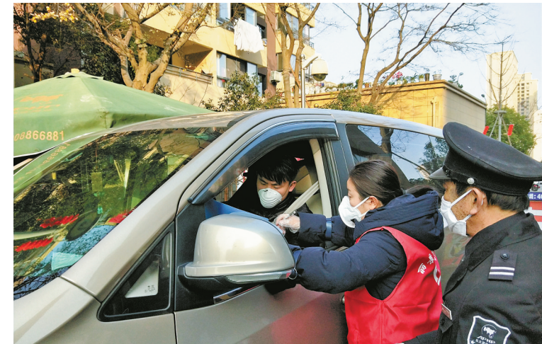
人员进入小区，必须测量体温。

为遏制疫情蔓延，自管控措施升级以后，该小区加紧印制了“出入证”。记者看到，这张浅粉色纸的