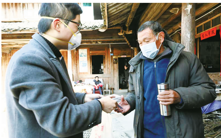
联村干部进村为老人送药。

“村里老人这么多，面临断药的，可不止这几个。”次日，他组织村干部，对两个村进行了一次排查，发现有26位老人、近60种药