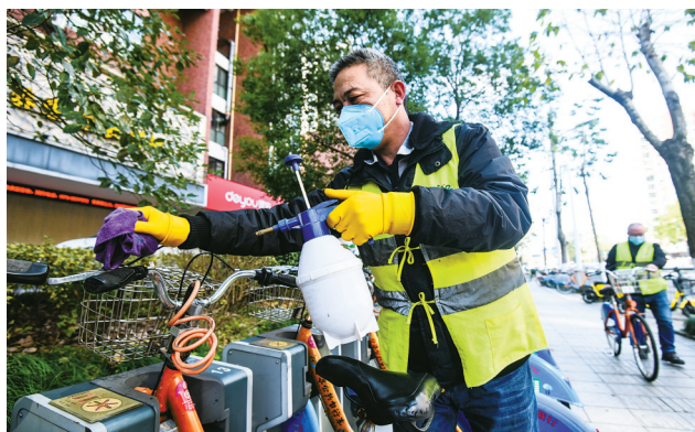
市公交集团组织力量每天对全市3.6万辆公共自行车把手、坐垫、刹把和中控屏等重点部位进行消毒。