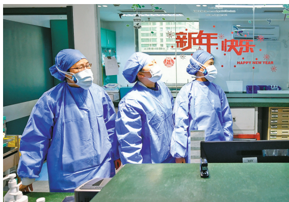
护士背后“新年快乐”四个鲜艳夺目的字，令人百感交集。