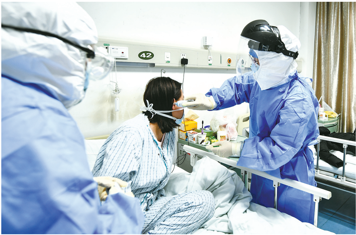
患者每天要测3次体温，如正处在发热过程中，还要增加测量次数。