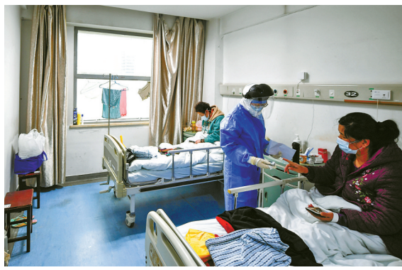
护士准备给患者检测脉搏和皮氧。