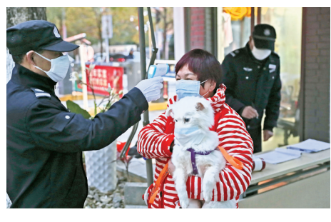
2月4日傍晚，江北区天合家园小区门前，保安为进出小区的居民测量体温，一位怀抱宠物的居民经过门岗。