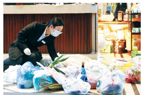
昨晚，鄞州区敦叙里小区入口处，物业工作人员为业主分拣送来的外卖物品。