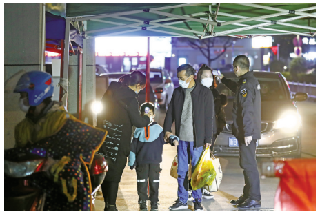
2月4日晚，鄞州区朱雀社区门口，保安手拿测温仪，为每一位进出小区的居民测量体温。