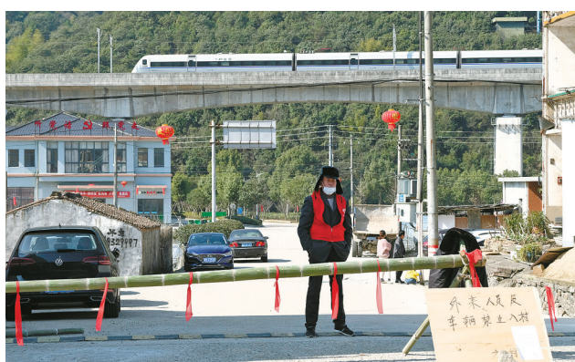
2月1日，奉化方门村口。