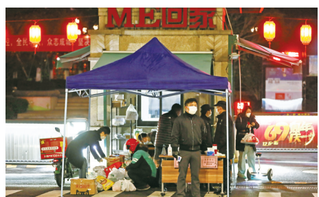
2月4日晚，江北区长岛花园小区门口搭起了小帐篷，一位保安手拿测温仪站在寒风中。