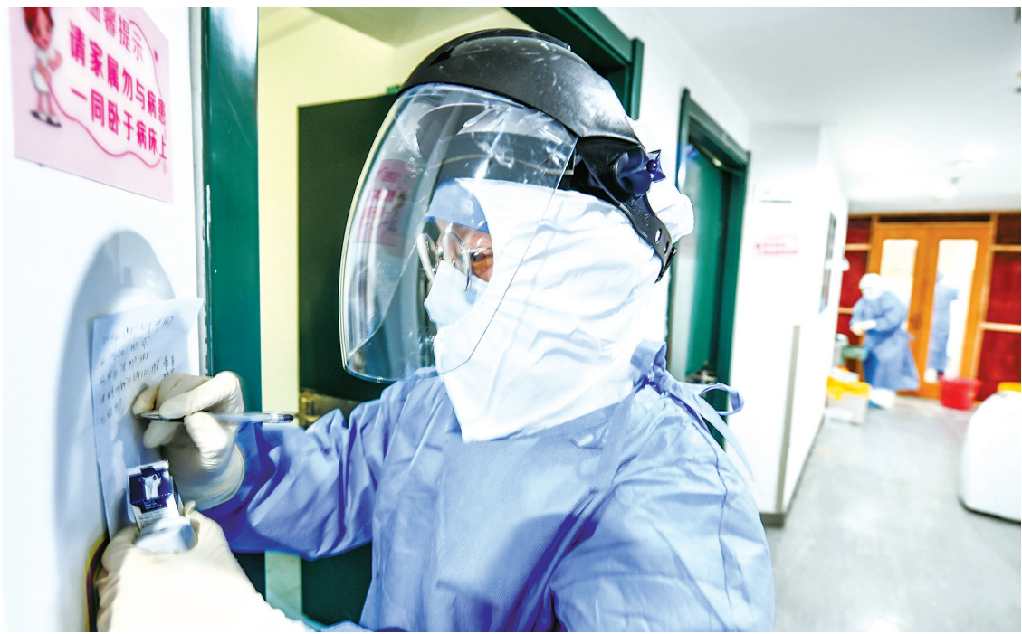
护士在记录患者的生命体征。