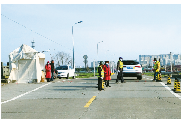
2月2日，高桥镇陆家庄路口。