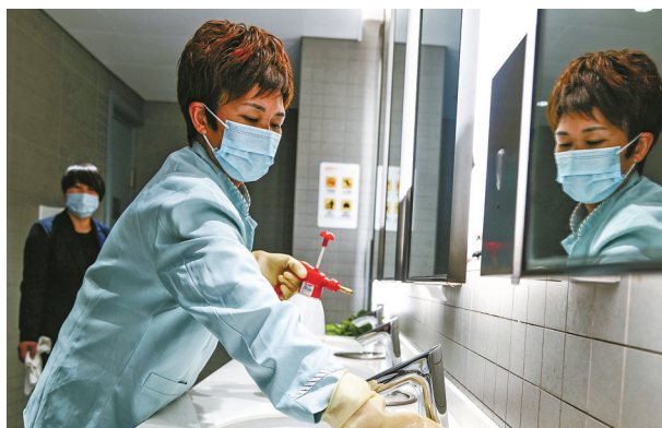
2月5日，在宁波栎社国际机场新航站楼，保洁人员正对卫生间进行消毒。