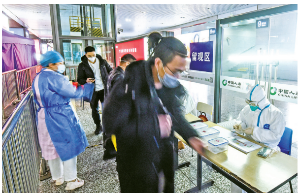
2月5日上午，在铁路宁波站，出站旅客接受体温检测。