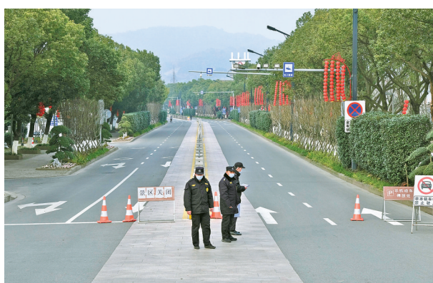
2月4日，慈城保黎北路口。