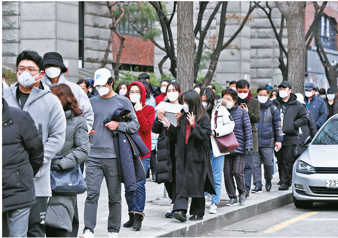
3月3日，人们在韩国首尔街头排队购买口罩。

澳大利亚卫生部门2日说，澳大利亚累计确诊病例数升至33例，其中新南威尔士州一名53岁患者的感染源尚未明确。该州首席卫生官克丽·钱特表示，这意味着很可能还有未被发现的感染者，需要保持警惕。