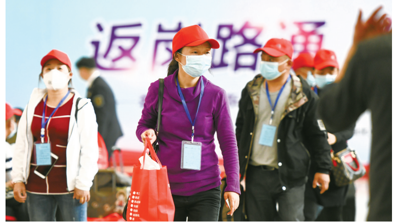
3月19日，两趟高铁专列“点对点”输送1631人前往广东企业返岗就业。13时20分许，搭乘551名湖北荆州务工人员的G4368专列从荆州火车站开出，这是今年春节后从湖北始发的第一列务工人员高铁专列。