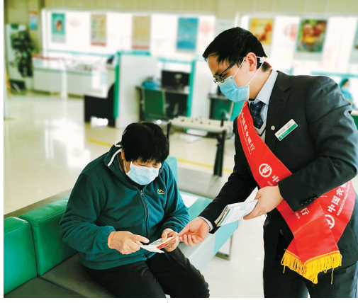
农行员工向客户普及金融知识。

画”等形式小视频和动漫作品,通过朋友圈、公众号、社区微信群等线上渠道进行推送和转发,取得了良好的宣传效果,创新的宣传形式和丰富的内容,使消费者保护权益知识进一步深入人心。为提升员工的消费者权益保护意识,该行还在企业微信公众号举行“3·15消保知识竞赛”,内容包括金融消费者的八项金融权利及办理业务时如何保护消费者权益等,切实提高消保工作水平。(徐婷婷)