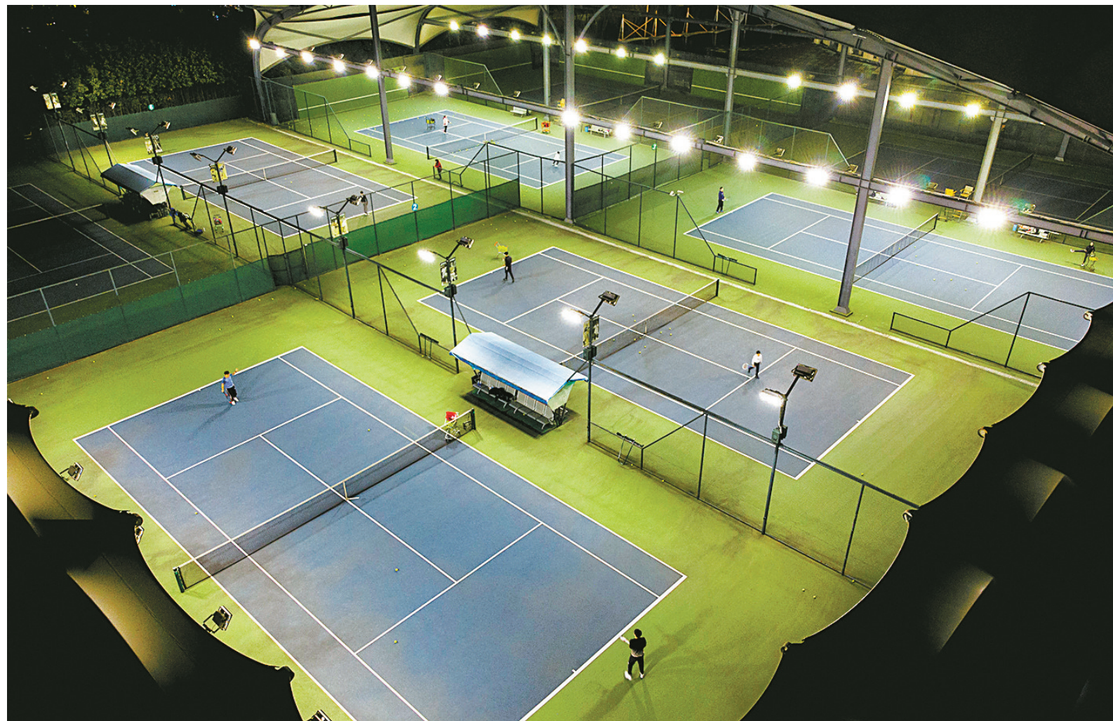
昨晚，在宁波体育中心，市民在网球场打球。近日，随着全省疫情防控应急响应调整为三级，我市在切实防止疫情反弹的前提下全面恢复生产生活秩序。