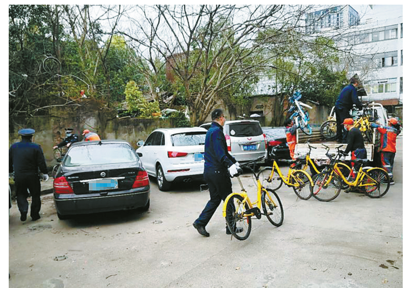
西门街道工作人员正在清理厂区内乱堆放的共享单车。

法官提醒，消费者应当增强自身的安全保护意识，不能将生命安全随意“托付”给公共场所管理人。当然，公共场所管理人应提供可靠的安全保障，例如配套服务设施、设备，必要时还应配备具有相应技能的保障人员。