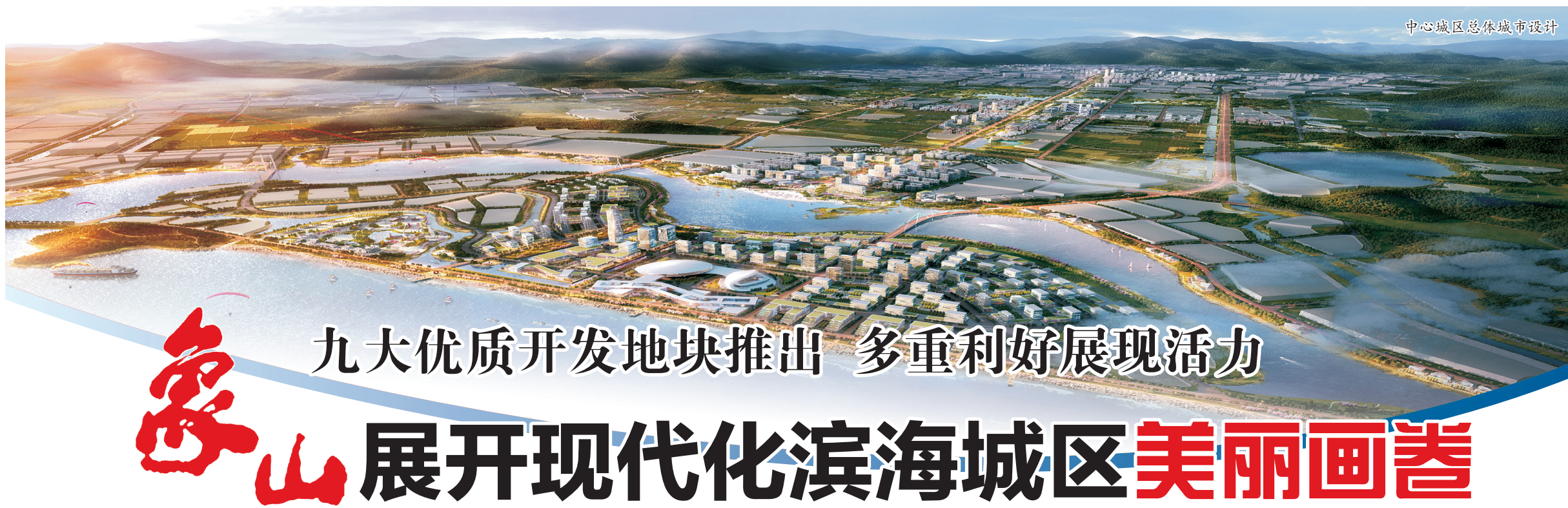
中心城区总体城市设计