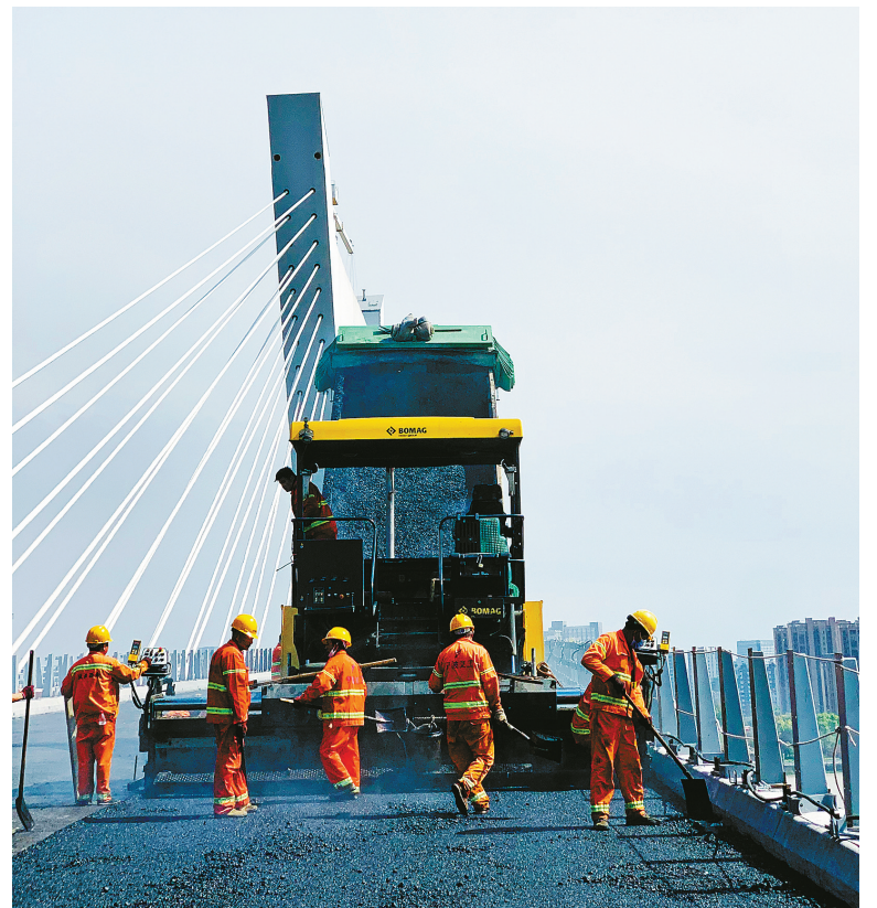
昨天上午，工人对中兴大桥主桥面进行沥青摊铺作业。