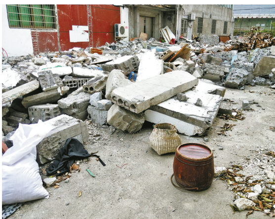
五乡镇中心小学和一所幼儿园附近，堆放的垃圾与周围格格不入。

到。”小区保安告诉记者。 此次暗访中，记者发现老旧小区楼道内的垃圾堆放现象明显减少。在鄞州、海曙、江北三区部分开放式小区内，楼道整洁，物业或居委会工作人员时常在清理。仅个别居民楼的楼道内放着一些纸箱、油壶、空可乐罐等。 路边建筑垃圾煞风景 仲春时节，鄞城大道两侧的杜鹃花开得正艳，路旁田里的油菜已经长出了细长的荚果。根据中国宁波网民生e点通网友爆料，记者来到鄞城大道与明光路交汇处的南侧，一处乱堆放的建筑垃圾煞风景。只见这里有4座半人高的“小山”，里面不仅有水泥块、碎砖块，还夹杂着碎玻璃、废钢筋和防水卷材。附近交通岗亭的工作人员告诉记者，14日上午7时左右，曾有一辆挖