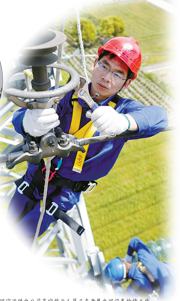
国网宁波供电公司高空作业人员正在开展电网设备检修工作。