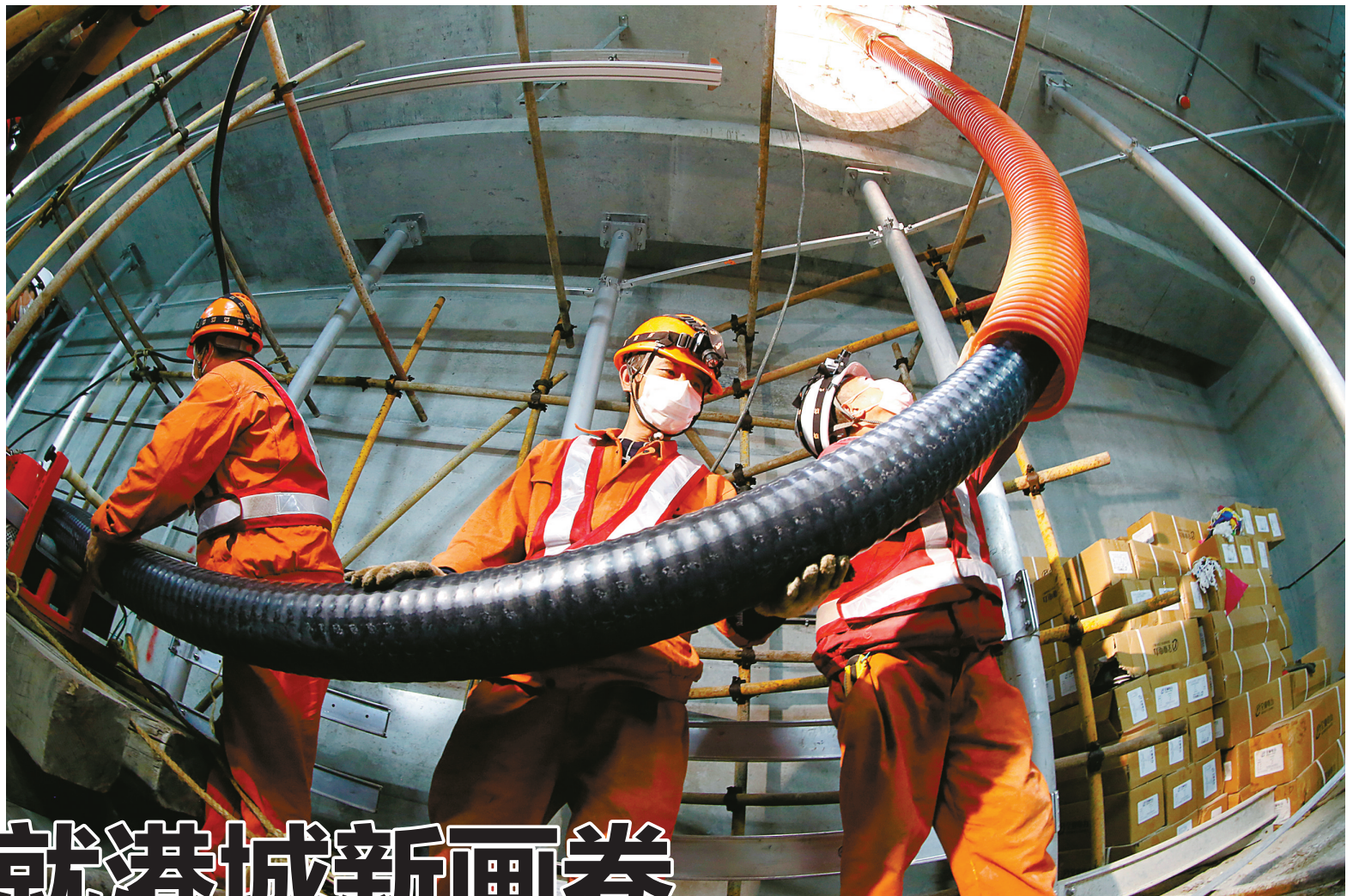
宁波舟山港的建设，也少不了电力支持。

举目已是晴空碧，宜趁东风扬帆起。在“电力铁军”的积极参与下，这座东海之滨的港口城市逐渐摆脱疫情阴霾，正徐徐展开美好画卷。