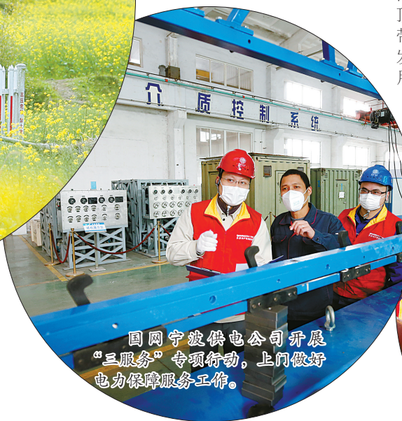
国网宁波供电公司开展“三服务”专项行动，上门做好电力保障服务工作。