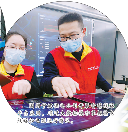
国网宁波供电公司开展智慧线路平台应用，通过大数据精准掌握输电线路和电缆运行情况。