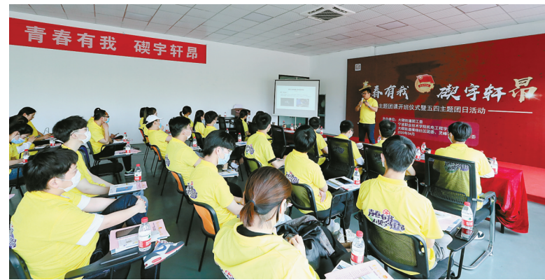
近日，以“青春有我，筑梦轩昂”为主题的青年团课在北仑区大碇街道“青春创客联盟”开讲，宁波职业

技术学院机电工程学院团委负责人为数十名青年主讲“时代匠心”第一课。