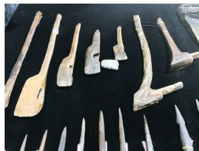
▲井头山遗址出土的先民工具。