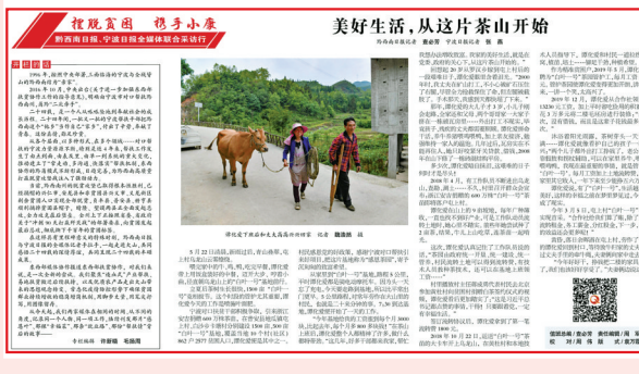
今天的《黔西南日报》同步刊登了相关报道。