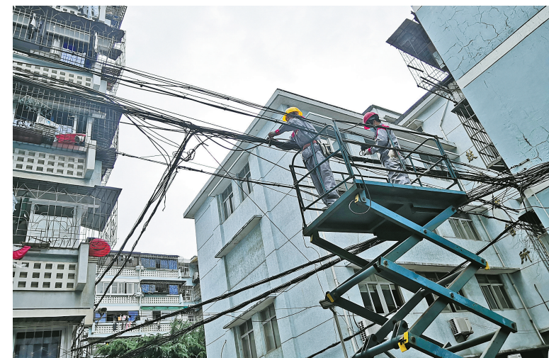
在缸桥巷小区，施工人员在登高车上进行架空线路整治。

营商分别搭建，初期缺少规划、管理混乱，如今很难准确厘清权责，甚至存在一些“无主线”。如果“一刀切”清理，不仅费用高昂，还会影响周边居民正常通信。“我们只能尽量规整线路，遇到长度太短或下垂很严重的线路时，我们会和其他运营商配合开展网络割