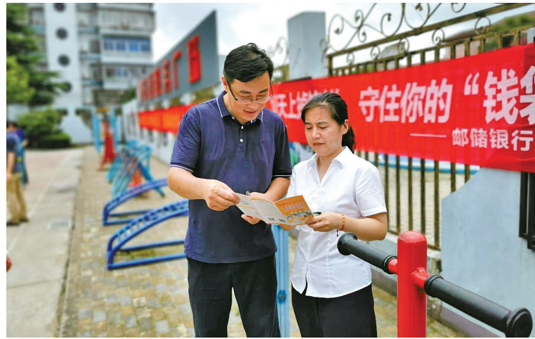
宣传员向居民讲解金融知识。