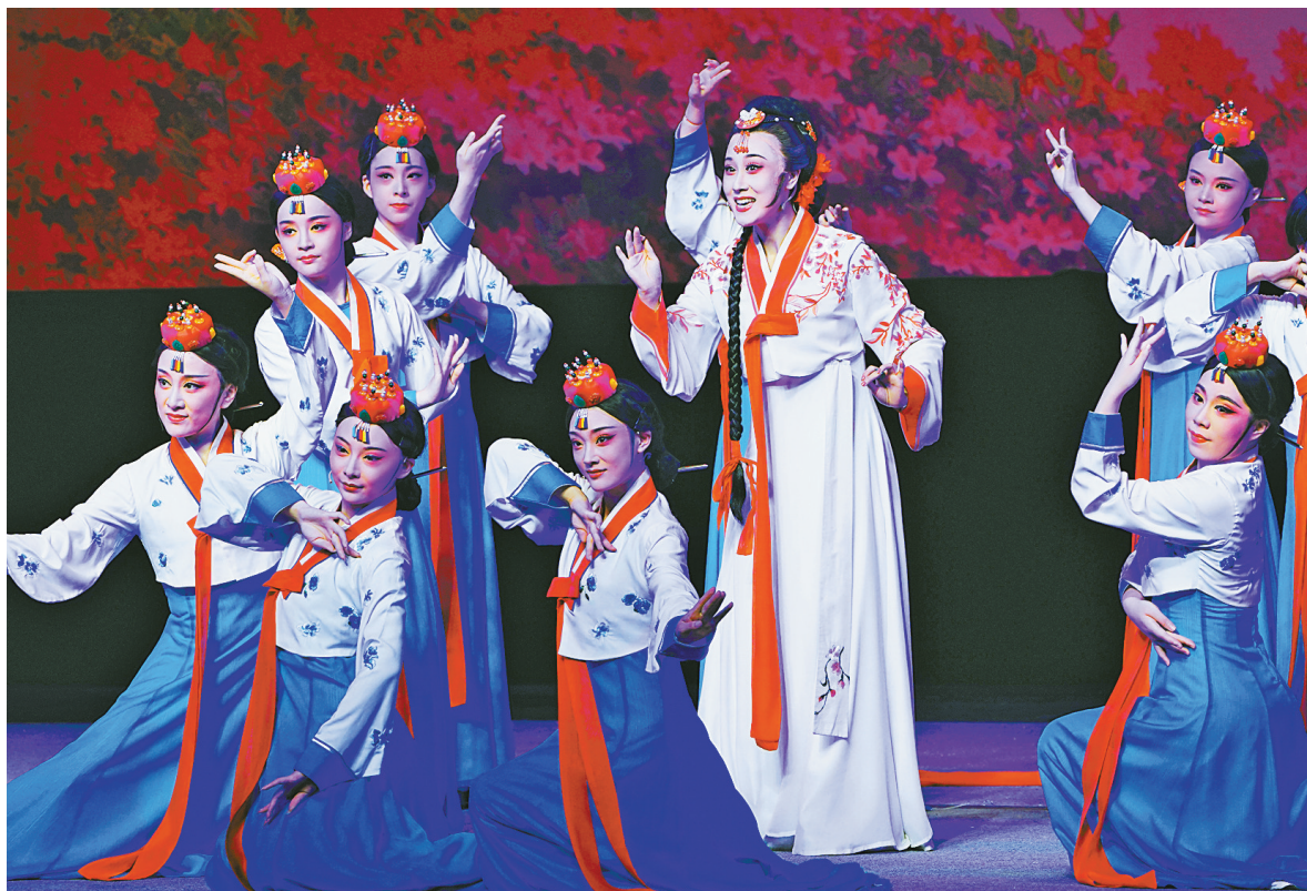
越剧《春香传》在宁波逸夫剧院复演情景。

近年来，逸夫剧院通过引进精品剧目，举办甬剧艺术节、艺术沙龙等，致力于文化惠民，打造了一个新时代戏曲展演基地——“戏码头”。剧院成立了戏迷群，征求他们喜爱的剧目，为戏迷量身定制戏曲文化大餐。“剧院的活力来自精