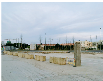
空地上的车辆被移走,划线工作开始。(傅钟中 摄)

6月17日,记者回访现场看到,场地内的比亚迪新能源车已被全部移走,地面上已开始划线。(傅钟中)