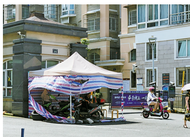
此前,江北区锦江花园大门外防疫检查点的帐篷破损,塑料布随风飘扬。