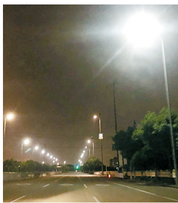
6月16日晚,申明亭路上已没有槽罐车违停。(廖业强 摄)

6月17日,记者回访现场看到,场地内的比亚迪新能源车已被全部移走,地面上已开始划线。(傅钟中)