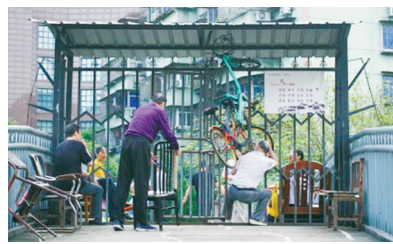
此前,鄞州区白鹤新村西侧通道居民钻“洞”进出。

记者从海曙区西门街道了解到,报道刊发后,翠南社区已安排相关工作人员将破损的帐篷进行拆除,并更换了一个新的帐篷。同时,街道还通知了各社区,要求各小区的防疫点帐篷进行检查,对破损老旧的帐篷进行更换,维护良好的城市形象。(仇龙杰 傅仲楠)