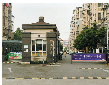
锦江花园大门前的帐篷已拆除。