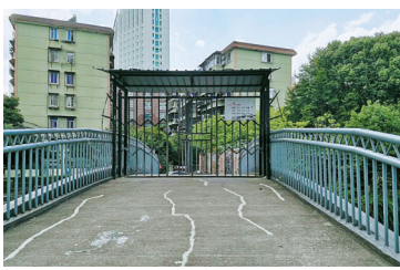
白鹤新村西侧通道已恢复通行,旋转门可正常转动。