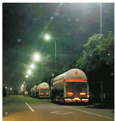
6月13日晚,申明亭路上停放着多辆槽罐车。

路与康庄北路的违停槽罐车均为重点整治对象。交警与庄桥街道联动作战,民警负责早上5时至夜间11