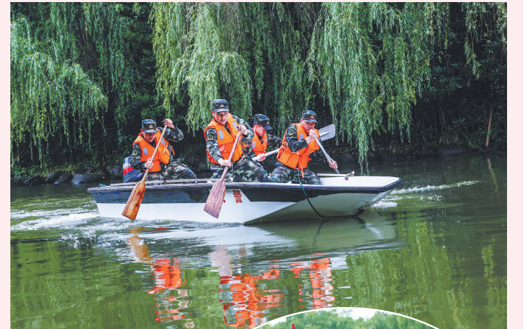
武警官兵开展冲锋舟集训，提升抢险救援能力。

“快速行进时，以何种方式持握铁钩等工具不会误伤到战友？”“因水情错过目标后应如何处置？”……为确保官兵闻令而动、有效处置，武警宁波支队还从细节处规范各类抢险救援处置要点、组织程序、安全防护等要求，进一步强化官兵快速反应、果断处置能力，为确保处置突发汛情、高效抢险救援奠定坚实基础。