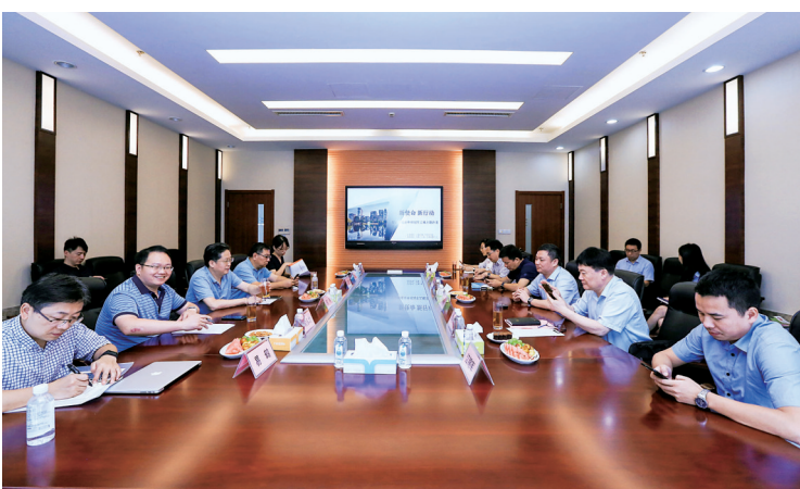
7月8日,以“新使命 新行动”为主题的宁波制造业单项冠军之城交流沙龙举行。

优化产业发展生态,也是宁波打造制造业单项冠军之城的重点。与会代表表示,我市各级政府部门应在应用场景、政府采购等方面,为单项冠军企业发展创造条件、提供便利。宁波日报记者易鹤结合采访中发现的共性问题,建议相关部门在“编制重大技术装备、软件、新材料等重大自主创新优质产品推荐目录,制定重点自主创新产品首购首用激励政策,积极推广重点自主创新产品”“支持国有投资项目业主单位和政府采购业单位,优先采购列入重点产品目录的首台(套)装备、技术、软件服务”等方面有更多实质性举措。