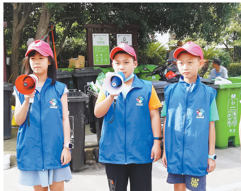
“绿色大桶装厨余,鱼骨刺菜扔这里;黑色大桶装其他,干干净净利大家……”昨天,由小志愿者组成的鄞州泰和社区“垃圾分类小喇叭宣传队”在小区宣传垃圾分类,并现场向居民分发宣传手册。