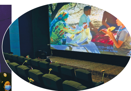
昨天,“中国电影 我们在一起”宁波影都首场启幕活动举行。影厅内,观众需间隔1米以上就座。