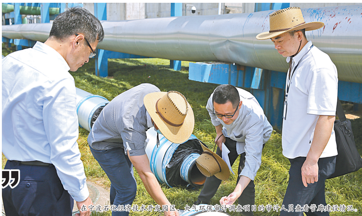
在宁波石化经济技术开发区,大气污染防治审计调查项目的审计人员查看管廊建设情况。

结构化处理技术等,有针对性地开展外围调查和实地延伸,缩短现场审计时间,实现“精准审计”。将遥感影像、无人机等先进技术运用到自然资源等审计中,借助测绘地理信息技术,通过多层叠加分析,快速锁定问题疑点和线索。