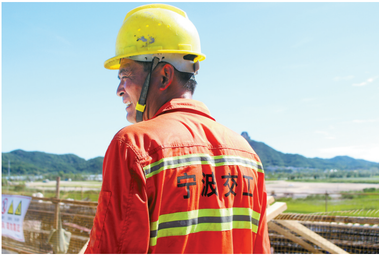
图为工程建设现场。