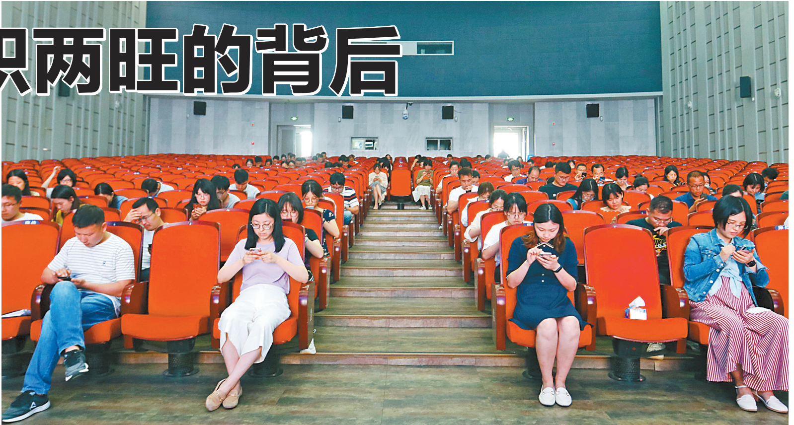
教师参加线上考试。

“不断有学校爆棚，然后挖潜扩班；不断有学校新建和扩建，满足各类人群的教育需求。这已经成为眼下南城各区县（市）教育局长们的一项重要工作。”一名不愿透露姓名的区教育局负责人说。