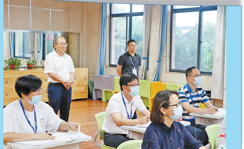
北仑区在线招聘教师。