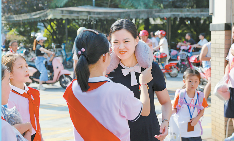
教师节，孩子们给老师送上护颈枕。